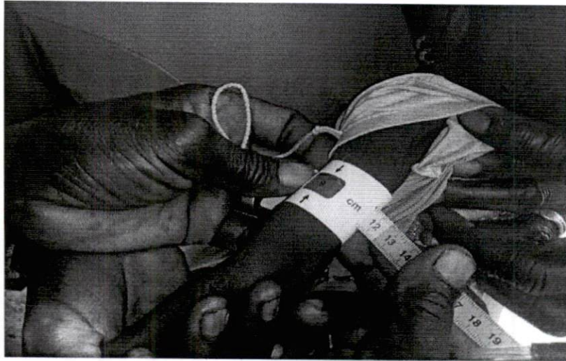
- Dépistage des enfants sur la malnutrition