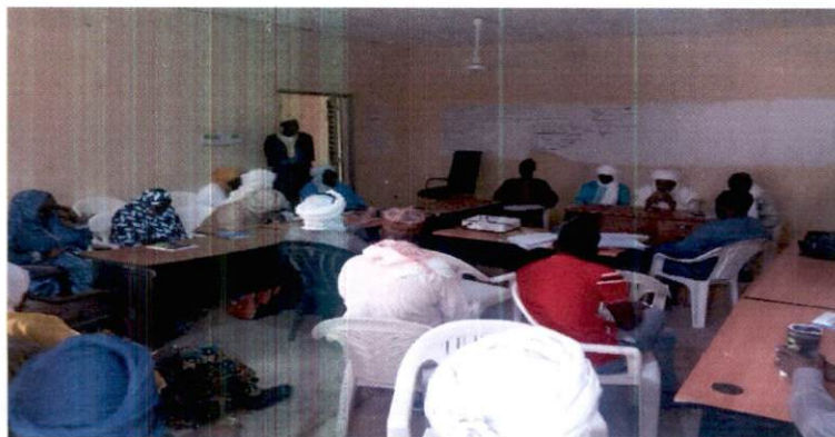
Photo : atelier de sensibilisation des maitres coraniques et leaders communautaires.