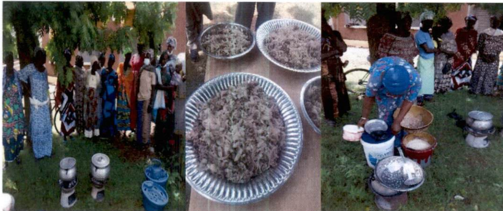
Formation des cuisinières de Tominian