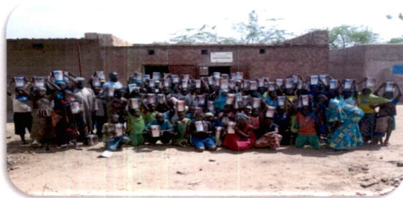
Séance de distribution RAE à Somadougou