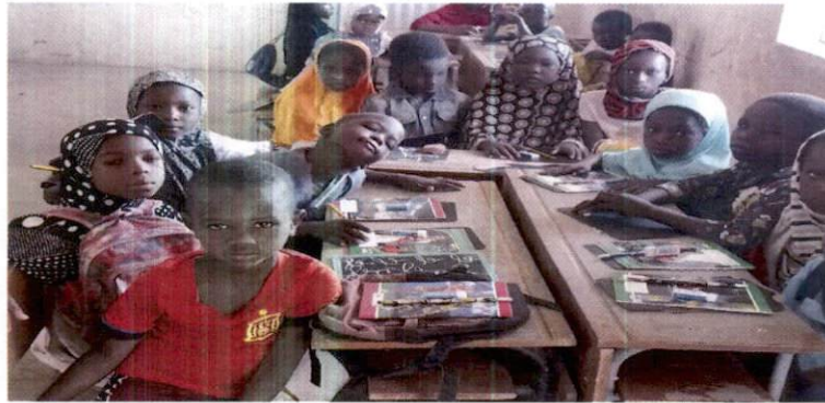
Photo : cours de rattrapage