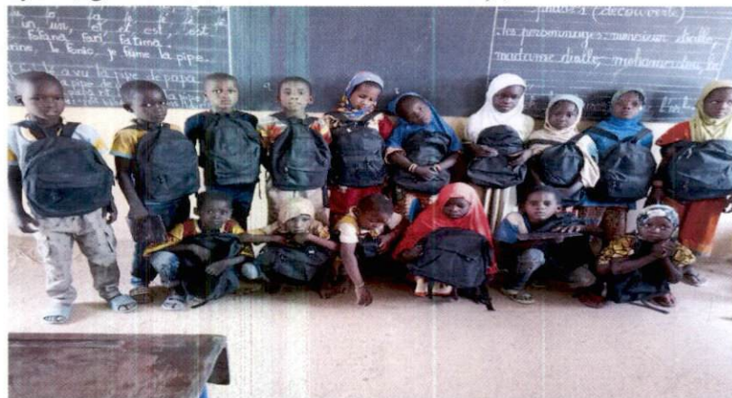
Distribution des kits aux enfants RMI :