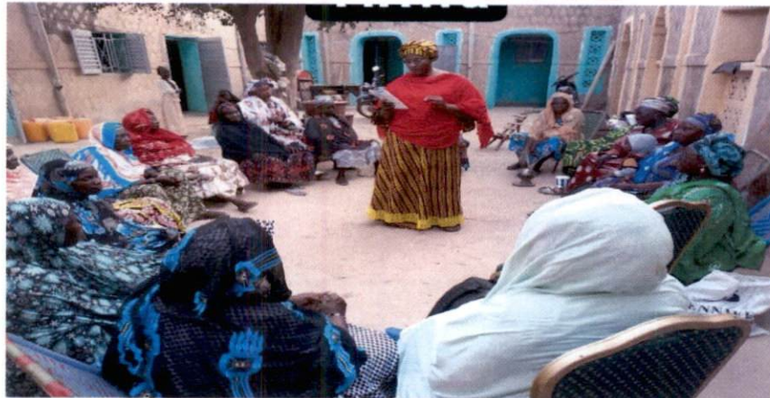
Restitution des séances de formation sur la gestion Administrative, Financière et Comptable