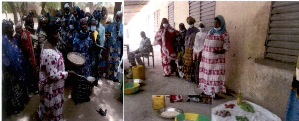
Démonstration culinaire lors de la formation des cuisinières à Djenné